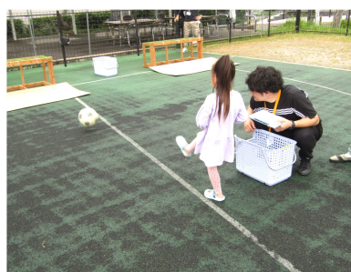
パーフェクトショット