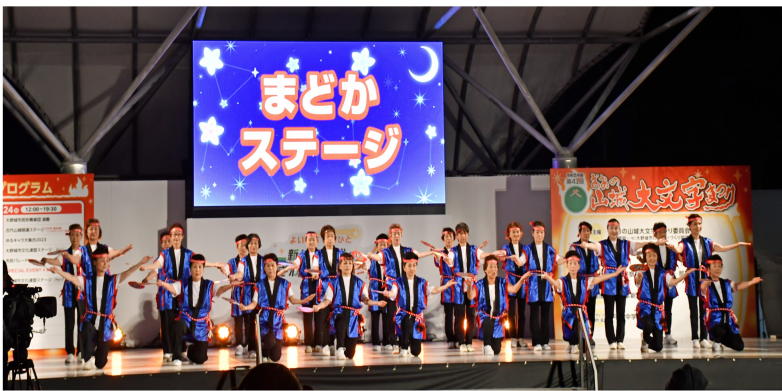
踊り隊ステージ、入場行進、フィナーレの大野城讃歌