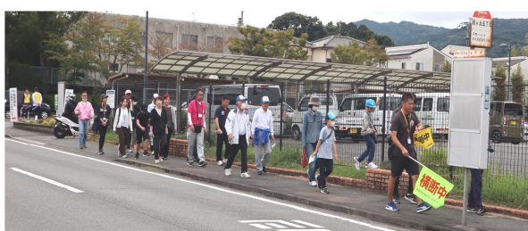
史跡探訪ウォーキング