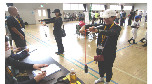
レク式体力チェック