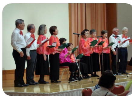
9月10日(日) つつじヶ丘区

令和5年度の敬老の日の式典及び祝賀会が昨年度とは違い、各区日時を変えて大野城市内にあるホテルで開催されました。8月末現在で南地区75歳以上の高齢者は、4,451人で、最高齢は103歳です。