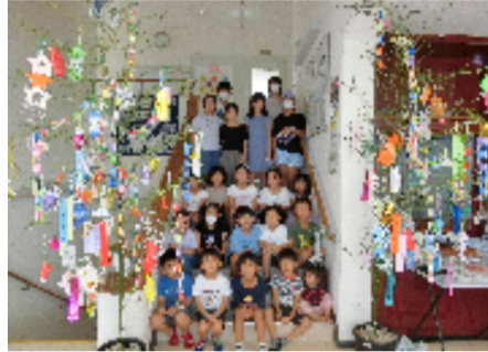
南ヶ丘2区の飾り付け