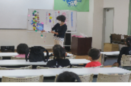
牛頸区の読み聞かせ