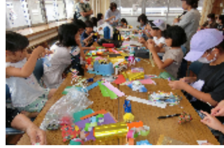
南ヶ丘2区の短冊造り