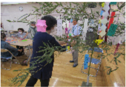
月の浦区の飾り付け