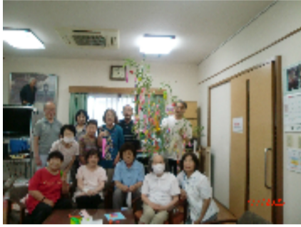
南ヶ丘1区の飾り付け

梅雨末期の豪雨の合間を縫って、各区の公民館やいこいの家では恒例の七夕まつりが華やかに開催されました。読み聞かせ等のイベントと併せて、参加した子どもや高齢者たちは青笹に願いを込めた短冊を付けて楽しみました。