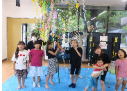
牛頸区の飾り付け