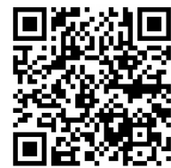
『天狗の鞍掛けの松』の QRコード